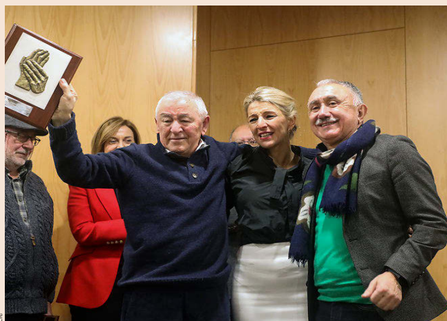
Yolanda Díaz, ayer, con su padre, Suso Díaz, a la izquierda, y el líder de UGT, Pepe Álvarez.

Con el gobierno socialista, y desde 2018, el SMI ha pasado de 736 euros al mes a 1.134 euros, lo que supone un incremento del 54%, esto es, 5.573 euros más al año, según informó ayer el Ministerio de Trabajo y Economía Social. En este último periodo, hasta 2023, esta renta que decide el