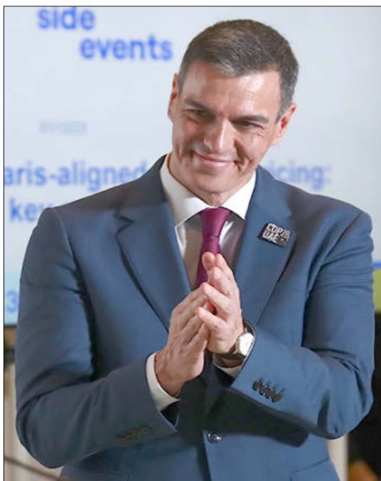
Pedro Sánchez, presidente del Gobierno.

ros y Navarra, que ha elevado sus costes un 17,3%, pasando de 2.841 euros a 3.334 euros. A continuación figuraría Cataluña, que cerró el segundo trimestre del año con un coste laboral de 3.313 euros, un 18,1% más que en 2018.