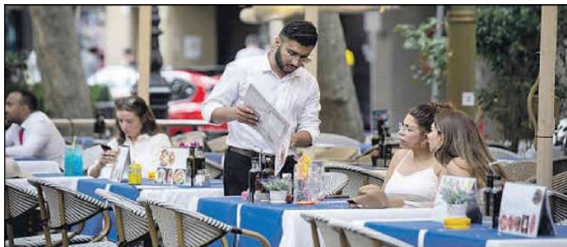
Una terraza en Madrid.