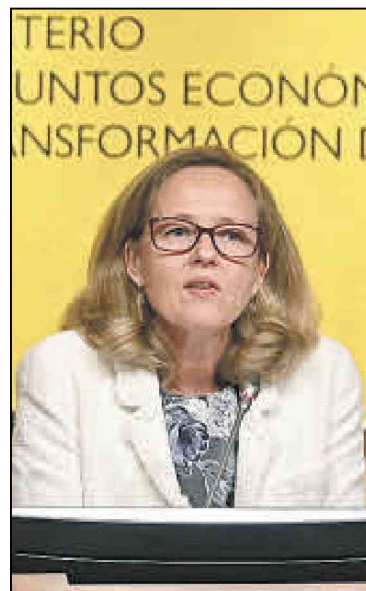
Nadia Calviño. EFE

Fue en el turno de intervención de las CCAA cuando se produjo la primera chispa entre los convocados. Una comunidad gobernada por