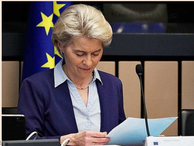
La presidenta de la Comisión Europea, Ursula von der Leyen.

La futura directiva, propuesta por Bruselas en octubre de 2020, no fija un umbral salarial mínimo para los 27, lo que sería poco menos que imposible ante la disparidad económica y de rentas en el bloque, sino que se limita a señalar la posibilidad de aplicar “valores de referencia indicativos comúnmente utilizados internacionalmente” como el 50% o el 60% del salario medio bruto de cada país. Ese último porcentaje es al que se ha aferrado el Gobierno de Pedro Sánchez para encadenar cuatro subidas consecutivas del SMI en España. Pero si la norma no habla de cantidades, si establece unas reglas de juego comunes en virtud de las que cada Estado miembro deberá evaluar si el salario mínimo fijado en su país es el adecuado para garantizar un nivel de vida digno atendiendo a las condiciones socioeconómicas, los niveles de productividad o el poder adquisitivo. No son recomendacio-