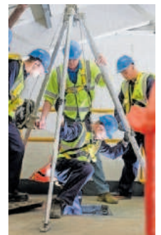
A mayor formación, menor probabilidad de permanecer parado.

La capacidad para abandonar el desempleo es inversamente proporcional a la edad, de forma que las personas mayores tienen una mayor probabilidad de permanecer en paro. Tres de cada cuatro mujeres y dos de cada tres hombres en paro mayores de 55 años lleva en esta situación más de un año. Asemplo advierte en este estudio de que las mujeres presentan mayores dificultades para abandonar el desempleo que los hombres, pues un 50% de las desempleadas