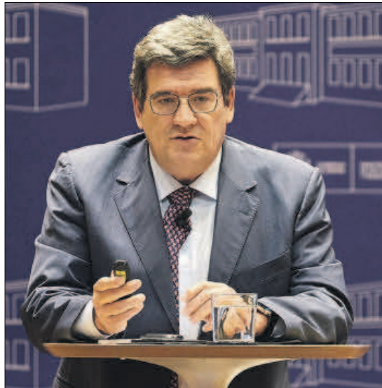
El titular de Seguridad Social, José Luis Escrivá.

partir de ahí nuestras medidas serán complementarias", explicó Escrivá en declaraciones a TVE ayer. Así, con las movilizaciones multiplicándose por la geografía española, las medidas entrarían en vigor al menos el 1 de abril, lo que implicaría culminar marzo con una