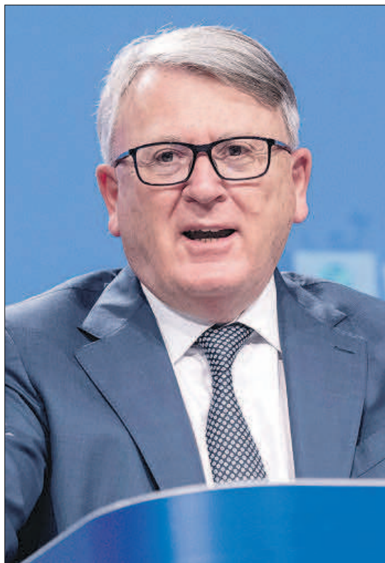
El comisario de Empleo y Derechos Sociales, Nicolas Schmit.

Desde CaixaBank Research exponen brevemente varias vías para reducir la intensidad y duración de estos desajustes y ayudar a que el funcionamiento del mercado laboral sea más eficiente e inclusivo. “Es preciso mejorar la empleabilidad de los trabajadores, adecuando la oferta académica a las necesidades del mercado, potenciando la Formación Profesional y reorientando las políticas activas de empleo, y también debemos asegurarnos de que los incentivos a la búsqueda de empleo son siempre los adecuados”, añaden los expertos.