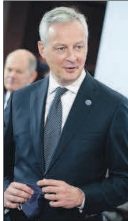
Bruno Le Maire.

La ratificación del fondo también parece que se desbloquea. Tras salvar el obstáculo del Tribunal Constitucional en Alemania, la izquierda polaca parece dispuesta a dar los votos que le podrían faltar al Gobierno de aquel país para dar el visto bueno a que la Comisión pida prestados los 800.000 millones de euros en los mercados. Solo quedan ocho de los 27 Estados miembros por ratificar este permiso, aunque algunos aprobados serán com-