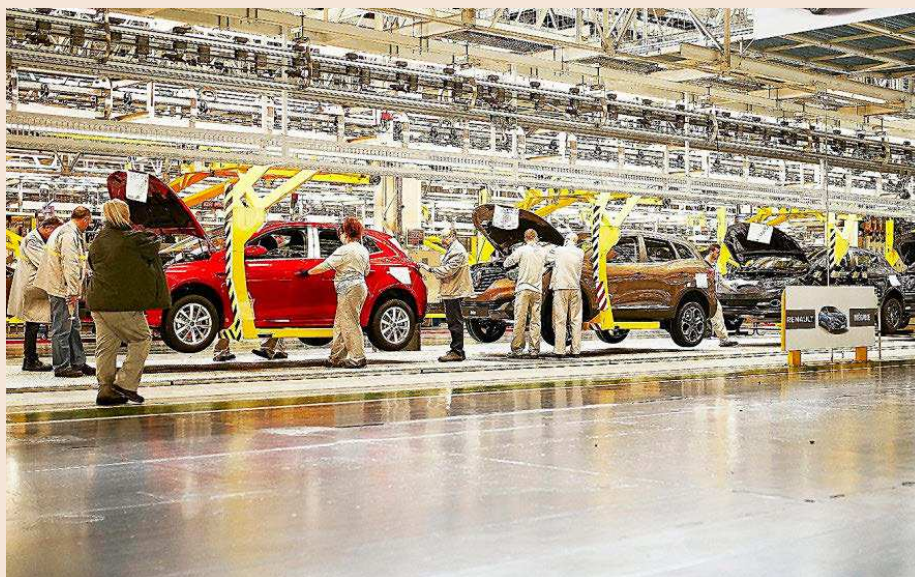
Trabajadores en la cadena de montaje de Renault, en Palencia.

Así, la Seguridad Social explica al trabajador que tiene la posibilidad de “continuar trabajando y aplazar la jubilación, como han hecho los actualmente casi 182.000 pensionistas que accedieron a una jubilación demorada”. Una decisión que “hará que se incremente su futura pensión”. En este punto, la carta explica uno de los incentivos que tiene el retraso de la reti-