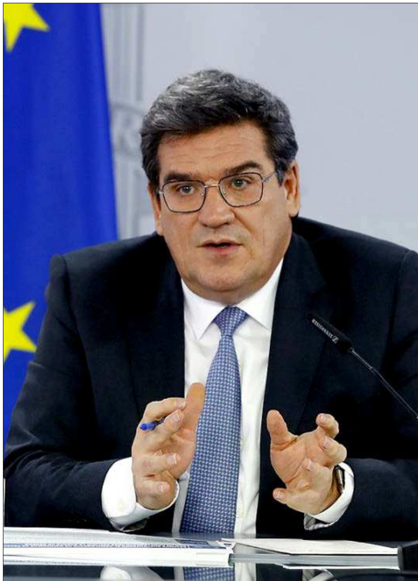
El ministro de Inclusión, Seguridad Social y Migraciones, José Luis Escrivá.

En este caso, tal y como avanzó este medio, según una de las propuestas que se estudiarán de UP-TA, una de las asociaciones representativas del trabajo autónomo implicadas en esta negociación, se aplicaría un primer tramo para aquellos autónomos que obtienen beneficios en el año por debajo del 50% del SMI para quienes se aplicaría una cuota del 30% de la actual base mínima de cotización, en 288 euros al mes. Mientras que para el grupo que se encuentra percibiendo ingresos entre el 50% del SMI -6.300