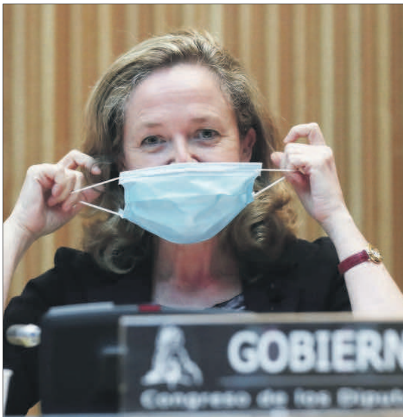
La vicepresidenta económica, Nadia Calviño.

Ahora, fuentes de Moncloa confirman que la reforma de pensiones se había guardado por un tiempo en el cajón a expensas de que pase lo peor de la pandemia y se pueda hacer una evaluación objetiva del impacto en las cuentas del organismo encargado de pagar las pensiones en nuestro país. No en vano, tras la aprobación del ingreso mínimo vital, no exento de polémica por el camino, el Gobierno ya tiene en el punto de mira el segundo gran consenso anunciado por el ministro del ramo, José Luis Escrivá, que es la reforma de las pensiones, donde se deberá abordar la situación financiera del sistema tras la Covid-19. Una línea que abona el hecho de que el Ejecutivo reseñe en el borrador del documento de compromisos como contraparte para la ayuda de la UE la reforma de pensiones, que sin ir más lejos la propia Comisión Europea, Fondo Monetario Internacional y OCDE llevan exigiendo a España hace años.