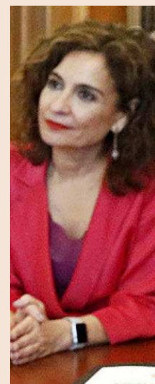
La ministra de Hacienda, María Jesús Montero.